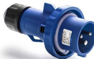
Ref. / Item 14200