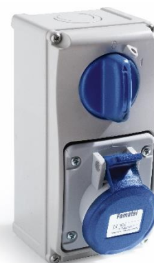
Ref. / Item 26008