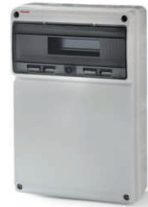
3952 500x330x155 16 módulos / 16 modules