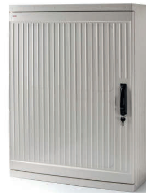
39168 / 39168-T 1000x754x322