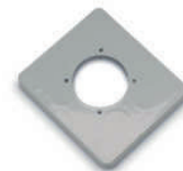
3905 Placa para tomas de corriente Cover for panel sockets