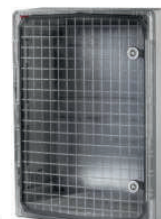
39146 / 39146-T 600x400x200