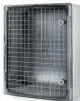
39145 / 39145-T 500x400x175