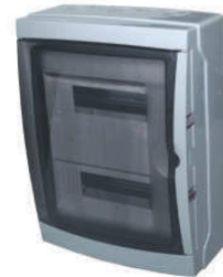
3926-T Mod-26 409x307x150