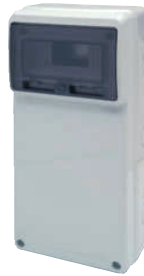
3951 500x230x155 8 módulos / 8 modules