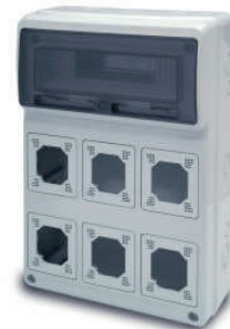
3962 500x330x155 16 módulos / 16 modules