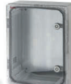
39134 / 39134-T 400x300x165