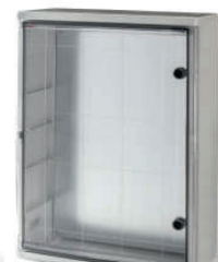
39157 / 39157-T 700x500x245