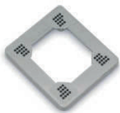
3902 Placa universal Universal cover