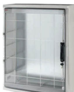
39168 / 39168-T 800x600x260