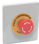
3919 Contacto NO NO contac