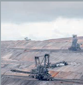
Petróleo y Gas