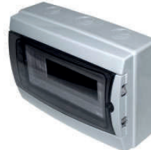
3912-T Mod-12 217x307x105