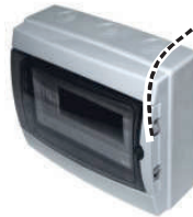
3908-T Mod-8 217x235x105