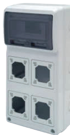
3961 500x230x155 8 módulos / 8 modules