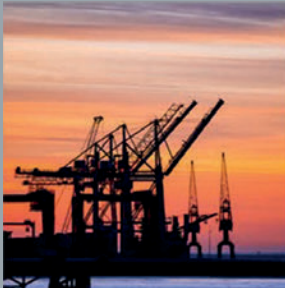
Petróleo y Gas

Diseñado para proteger componentes eléctricos de la acción del tiempo en los más variados sectores de la industria.