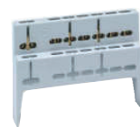
SPTA-12 Soporte regleta Terminal bar