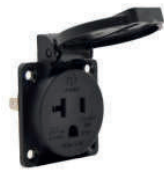
13958 Toma americana IP54 American socket IP54